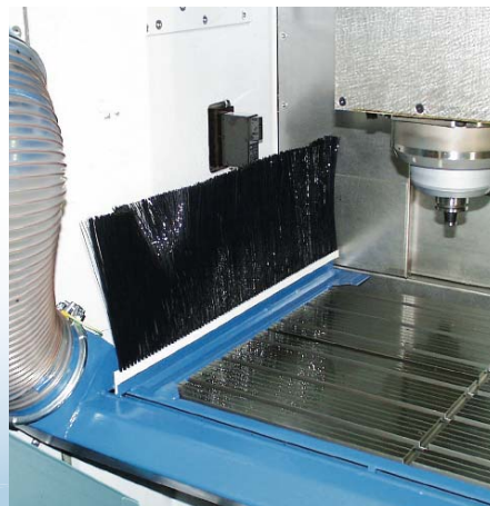
Patentiertes Tischabsaugsystem RSS1